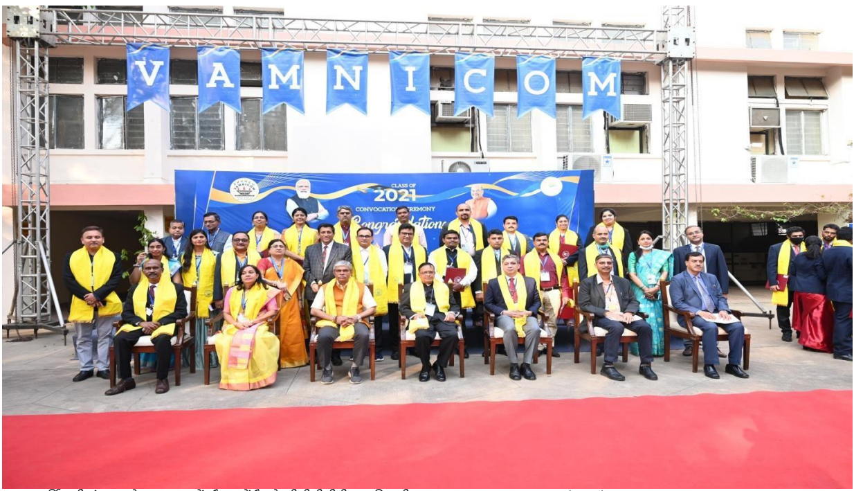
(वार्षिक दीक्षांत समारोह 2021- 53 वें और 54 वें बैच के पीजीडीसीबीएम प्रतिभागी Annual Convocation 2021- 53 rd & 54 th Batch PGDCBM Participants)