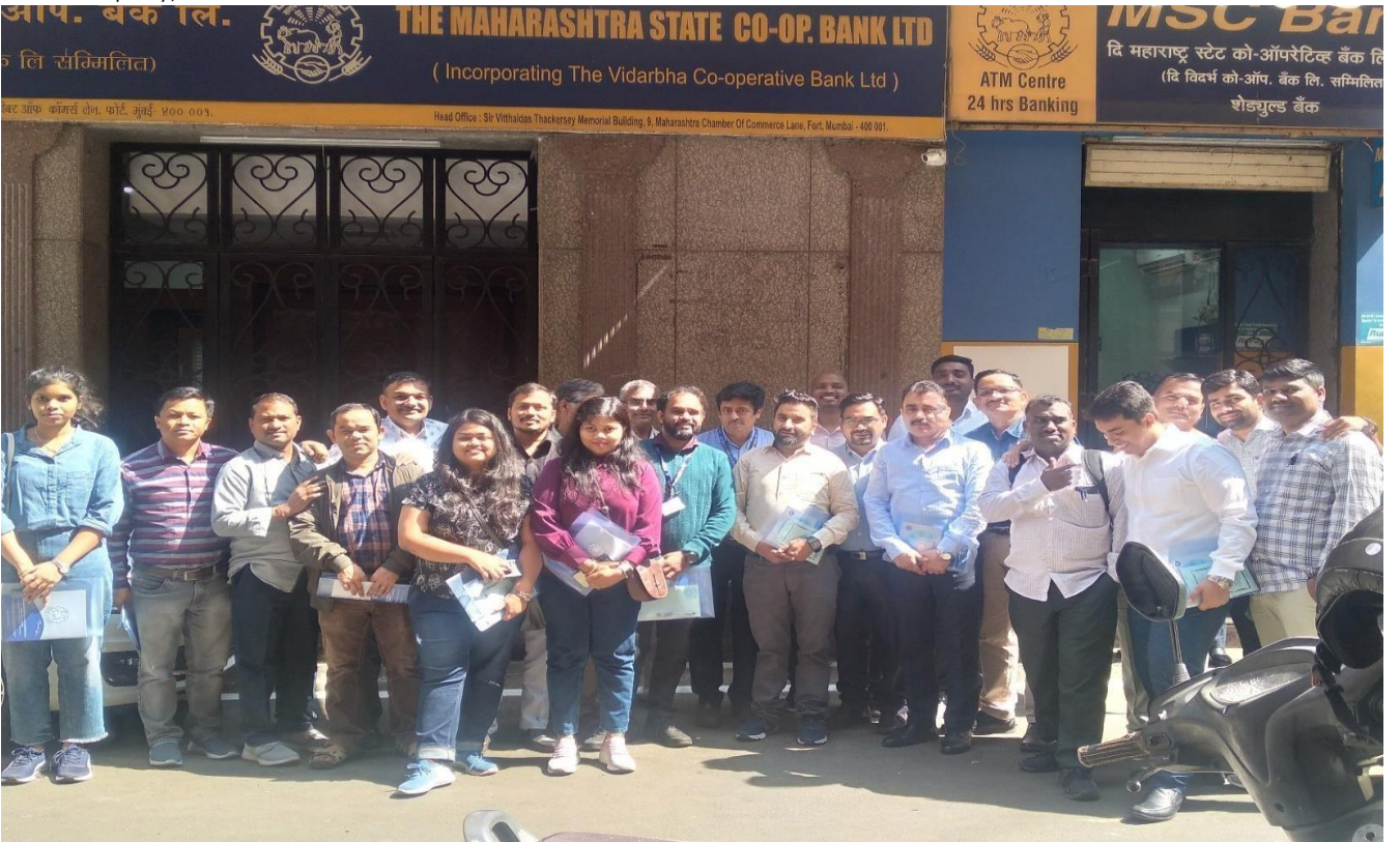
56 वें बैच के पीजीडीसीबीएम प्रतिभागियों का महाराष्ट्र राज्य सहकारी बैंक लिमिटेड का एक्सपोजर दौरा Exposure visit of the 56 th Batch PGDCBM participants to Maharashtra State Cooperative Bank Ltd.