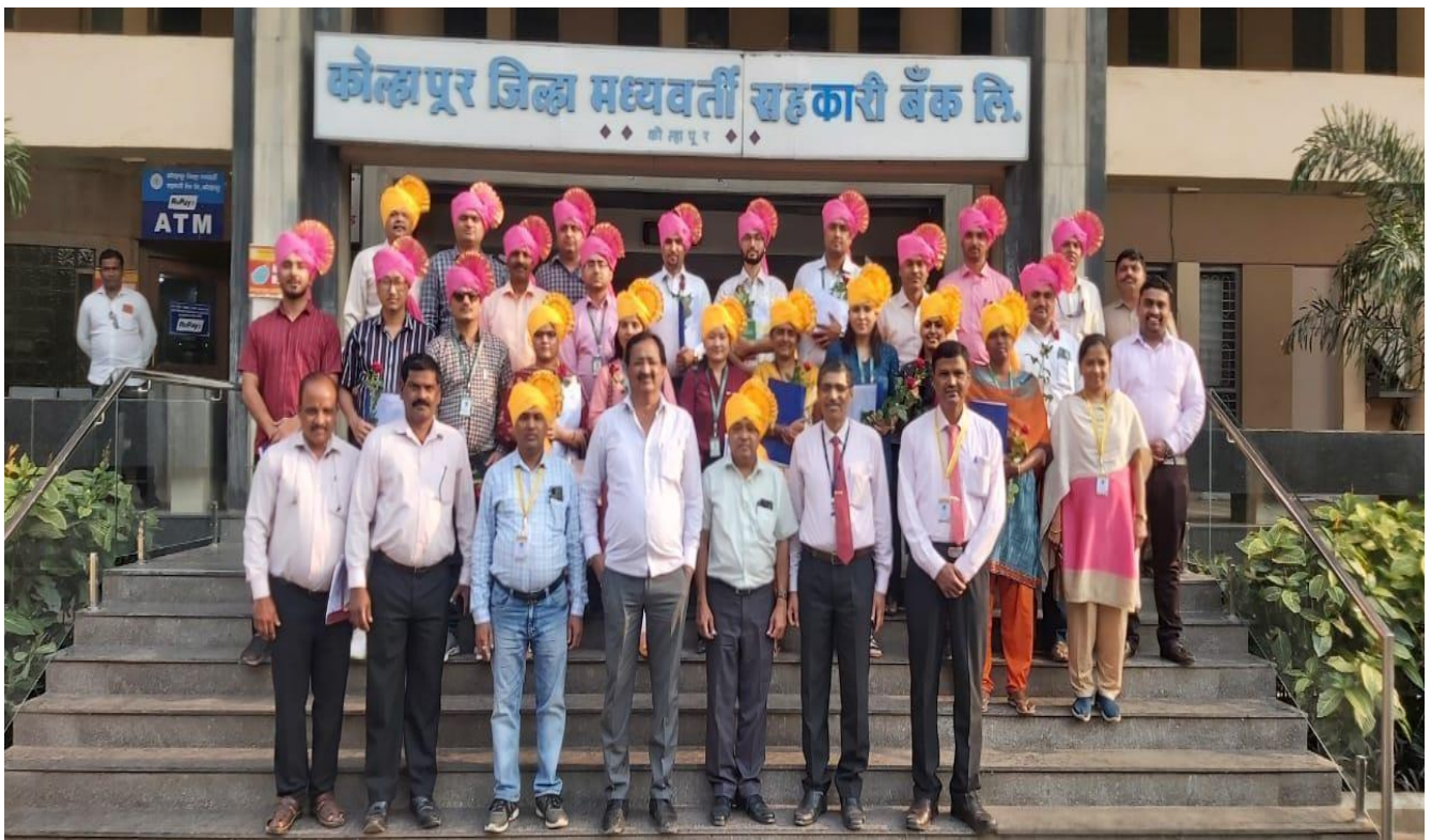
कोल्हापूर जिला केंद्रीय सहकारी बैंक लिमिटेड में 55वें बैच के पीजीडीसीबीएम प्रतिभागियों का एक्सपोजर दौरा, कोल्हापूर