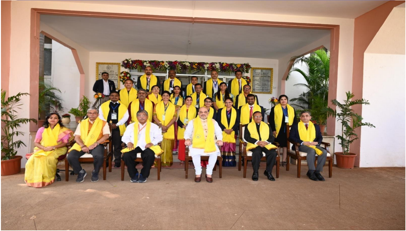
(वार्षिक दीक्षांत समारोह 2021-53 वां और 54 वां बैच पीजीडीसीबीएम-रैंक धारक Annual Convocation 2021-53 rd & 54 th Batch PGDCBM –Rank Holder) पीजीडीएम-एबीएम 2019-21 बैच के रैंक धारकों और 53 वें और 54 वें पीजीडीसीबीएम प्रतिभागियों और वैमनीकॉम के संकाय सदस्यों की समूह तस्वीर, श्री अमित शाह, माननीय गृह मामलों और सहयोग मंत्री, भारत सरकार के साथ Group photo of the rank holders of PGDM-ABM 2019-21 batch and 53rd & 54th PGDCBM participants and faculty members of VAMNICOM along with Shri Amit Shah, Hon'ble Minister of Home Affairs and Cooperation, GOI