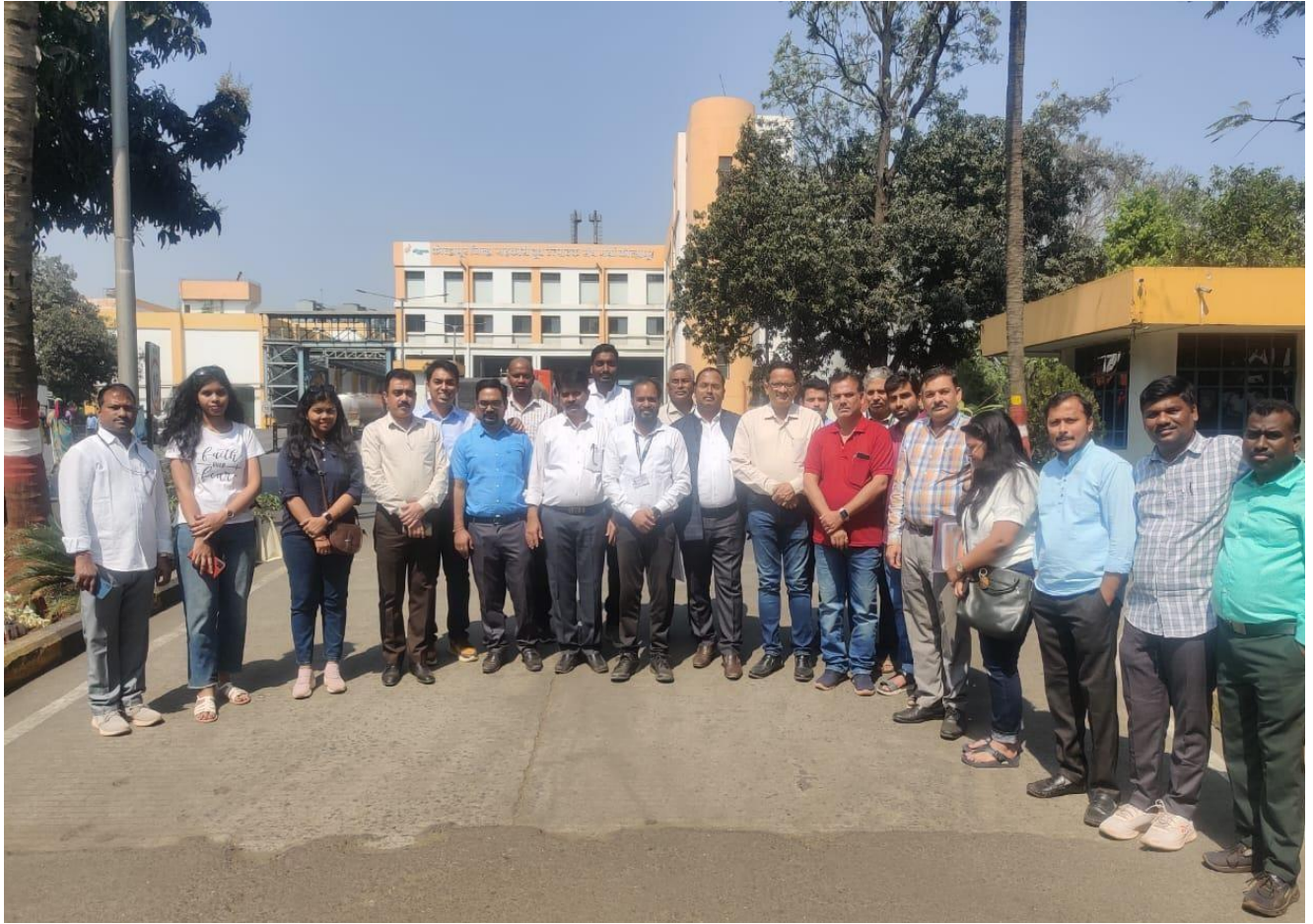
56वें बैच के पीजीडीसीबीएम प्रतिभागियों का वाराणा का एक्सपोजर दौरा Exposure visit of the 56 th Batch PGDCBM participants to WARANA