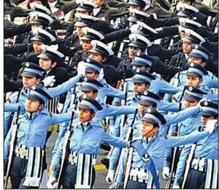
परेड में शामिल भारतीय वायु सेना की टुकड़ी।